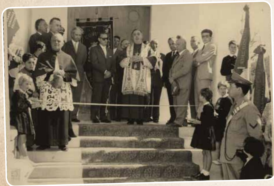
Inaugurazione sede comunale (1959)