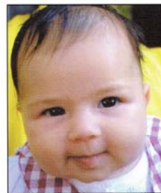
Petrolati Vittoria Emilia